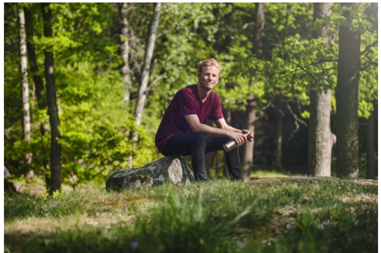
Skogsägare får chansen att lära känna sin skog bättre.

Remissvaren ska ha kommit in till Miljödepartementet senast den 30 april i år.