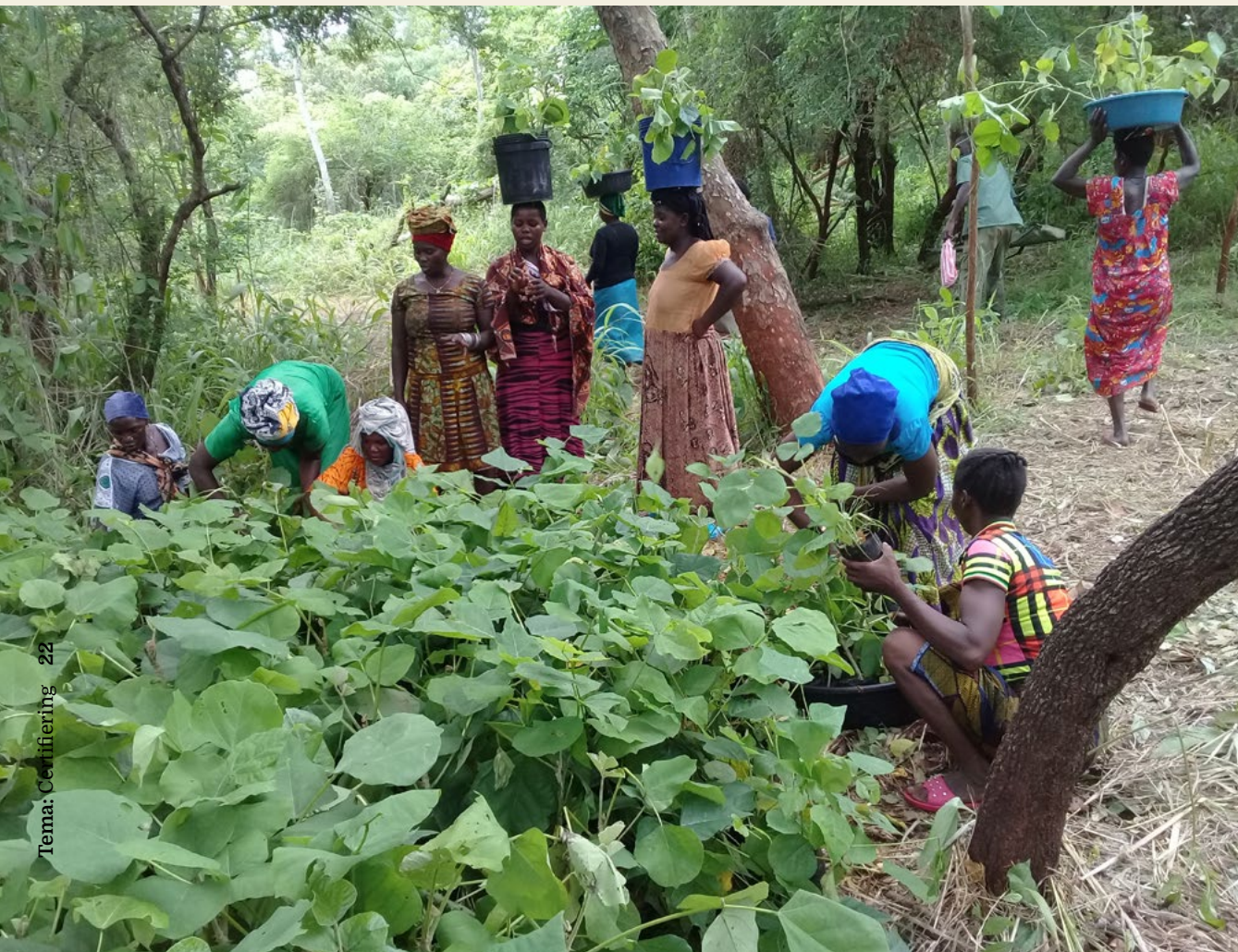
Plantering av korallträd i Mchakama by, Ewrytrina, i sydöstra Tanzania. Man trodde tidigare att korallträdet var utrotat, men efter att några träd hittades vid Mchakama har bybor planterat tusentals plantor och räddat den för framtiden.