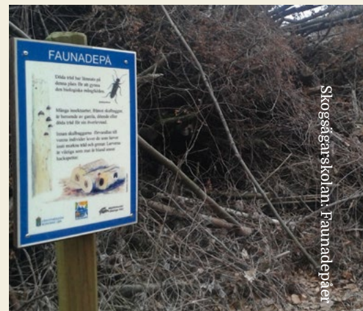
Sätt upp en skylt!

– Den sköter sig i princip själv. Det du kan göra är att röja lite runt den om det kommer upp sly som skuggar. Man kan också fylla på med ny ved då stockar i olika förmultningsstadier används av helt olika arter. De som vill ha färsk ved måste ständigt ha påfyllning om de ska bo kvar. När stocken mjuknar tar andra arter över – och så fortsätter kretsloppet ända tills stocken försvunnit helt. ♣