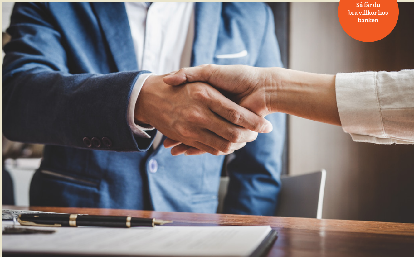
Kom förberedd till banken så ökar dina chanser att få bra villkor.

innebär för stora risker eftersom den kan blåsa ner i en storm när som helst. Dessutom är skogen inte öronmärkt, vilket innebär att markägaren kan avverka den när som helst.