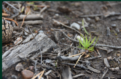
Naturlig förnygring av tall med fröträdsställning ger ett stort antal nya tallplantor, vilket är en fördel när betetrycket är hårt.