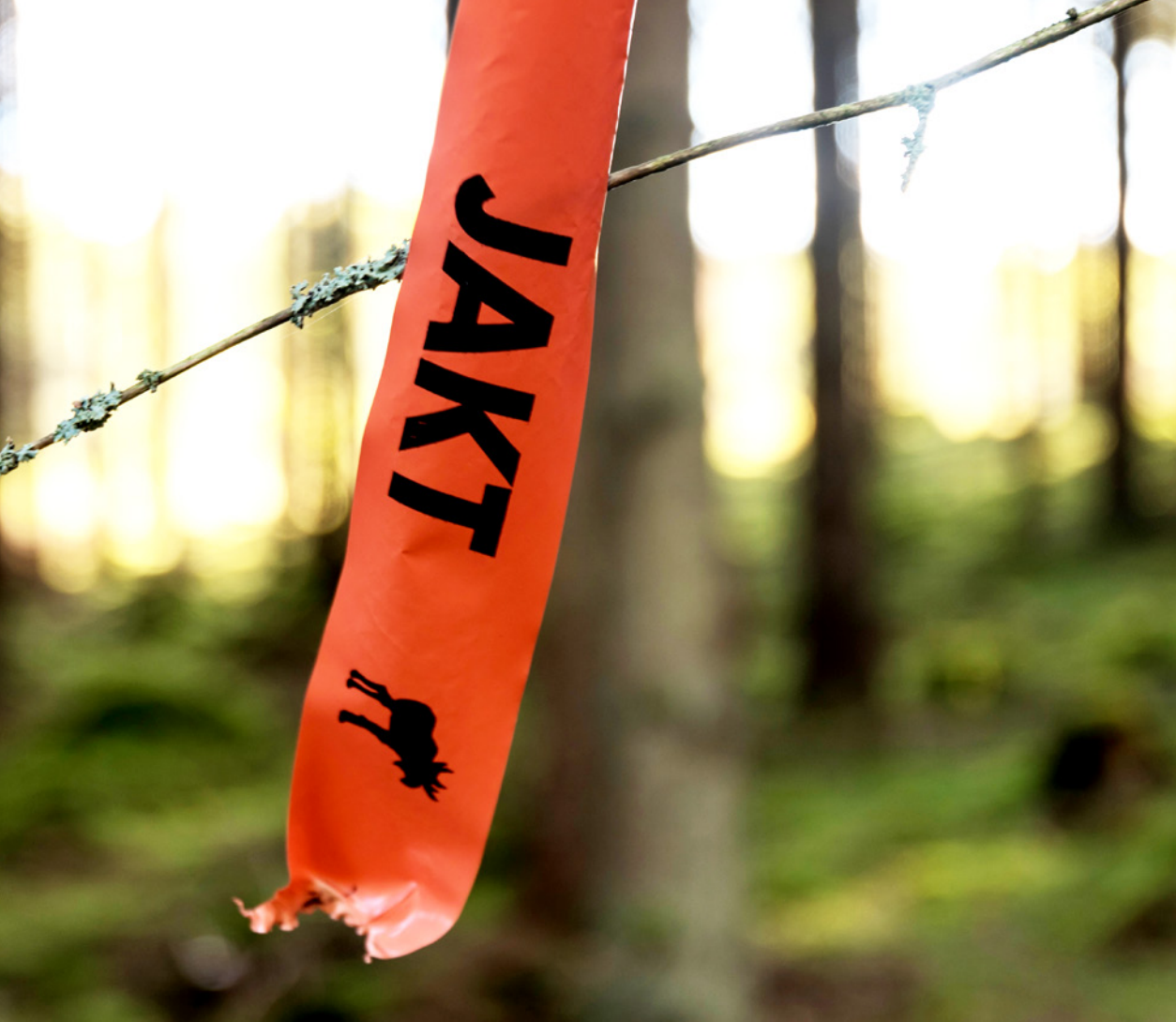
En av lösningarna är att skjuta mer älg.