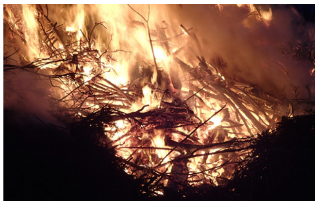
Efter branden har nya regler införts.

OAVSETT UTFALLET I DOMSTOLEN har branden i Västmanland fått följder gällande branschens ansvar för bränder. För två år sedan infördes nämligen bestämmelser i syfte att undvika bränder från skogsmaskiner. Riktlinjerna säger bland annat att skogsarbete med maskin inte ska utföras om den högsta nivån av brandrisk på en femgradig skala råder.