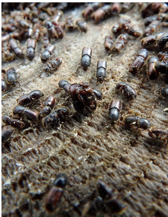
Mycket tyder på att angreppen blir värre än i fjol.