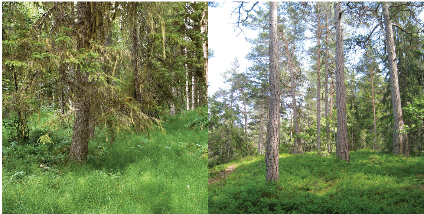
Granskog på torvmark med fältskikt dominerat av fräken, Ramsäle, Ångermanland (t.v.). Tallskog på moränmark med fältskikt dominerat av blåbär, Tyresö, Södermanland (t.h.).