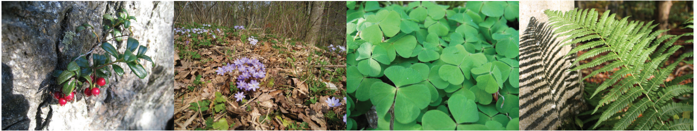
Figur 3. Lingon är en av flera risväxter som minskar i frekvens i södra Sverige. Blåsippa minskar i södra Sverige men ökar i norr, och är därmed en av mycket få arter med motsatta trender i de två landsdelarna. Harsyra är en av flera skuggtåliga arter som ökar i hela landet. Träjon är en av flera ombunkar som har ökat i frekvens under de senaste tjugo åren.

Framtida uppföljningar kommer att visa om effekterna av de globala miljöförändringarna och av ett ändrat skogsbruk som vi ser i södra Sverige så småningom även påverkar norra Sveriges skogsvegetation i större omfattning. Särskilt om en ökad till-