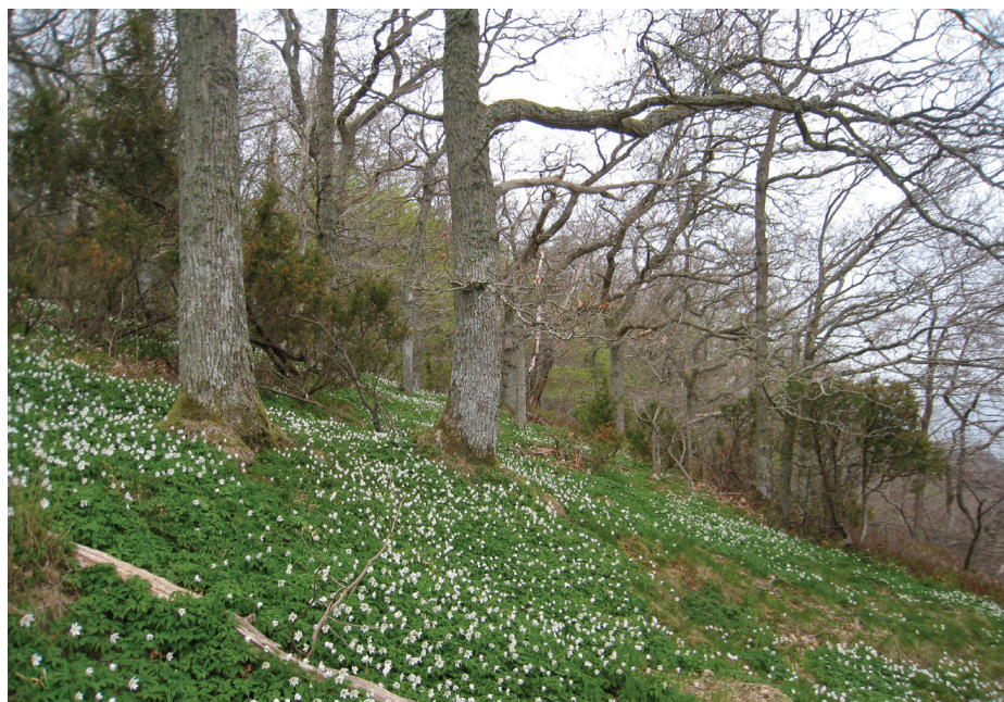
Ekskog av lågörttyp på Stenshuvud, Skåne. Den ljuskrävande enbusken minskar i Sveriges skogar medan vitsippans förekomst har varit stabil under de senaste 20 åren.